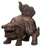
明治天皇御料 唐獅子 (複製)