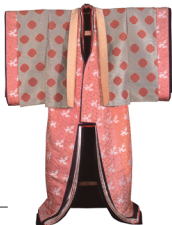
明治天皇第九皇女 泰宮聡子内親王御料 五喜侍衣裳 (複製)